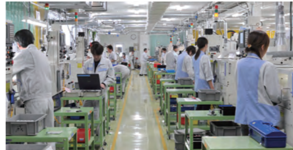
環境に配慮したクリーンな切削加工ライン